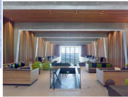
Hôtel-restaurant Chetzeron – Crans-Montana.