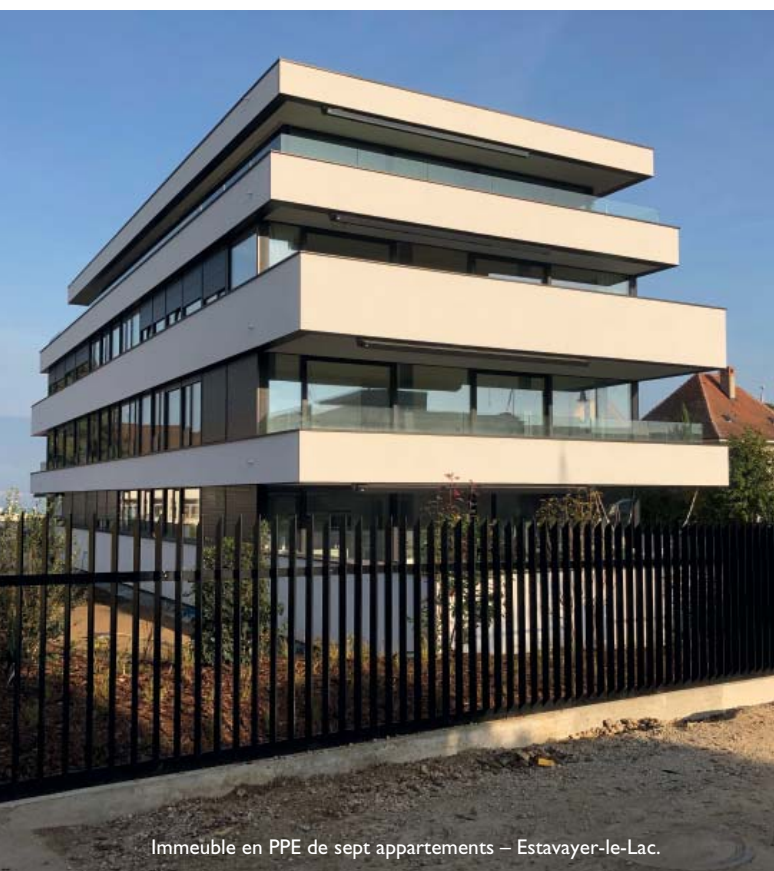
Immeuble en PPE de sept appartements – Estavayer-le-Lac.