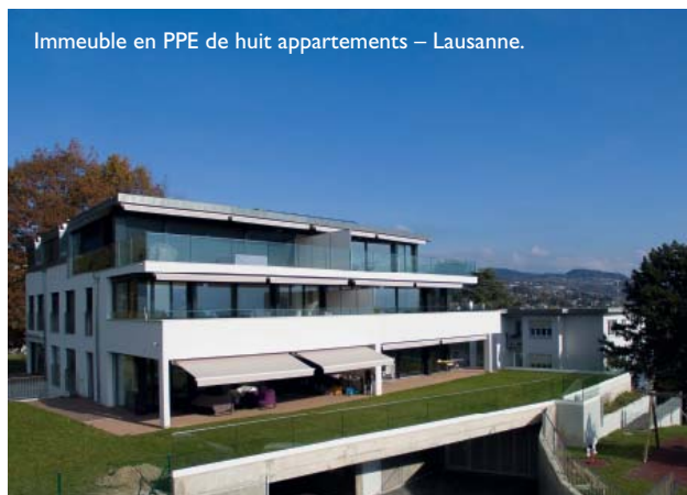
Immeuble en PPE de huit appartements – Lausanne.

Cet immeuble aux lignes dynamiques propose une architecture imaginative et créative. Grâce à la domotique, certains propriétaires peuvent gérer leur énergie et piloter leurs appareils électrodomestiques depuis leur portable. Les travaux réalisés ont duré 16 mois.