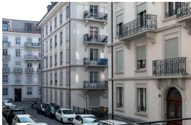
Rénovation totale et aménagement des combles – Rue des Echelettes 2 à 12, Lausanne (2011-2018).

A la demande de la commune, une salle de sport, labellisée Minergie-P et un parking souterrain, ont dû être construits dans des délais très courts. SD Construction a piloté le team de mandataires pour l'ensemble des phases sia.