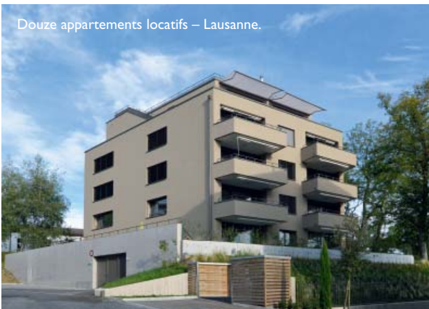
Douze appartements locatifs – Lausanne.

En respectant la topographie existante, le projet intègre de manière optimale les contraintes réglementaires. Il exploite avec intelligence le règlement communal, les alignements sur le chemin des Roches et les distances aux limites pour optimiser la surface bâtie.