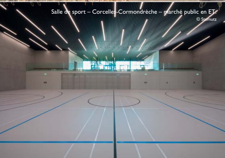
Salle de sport – Corcelles-Cormondèche – marché public en ET.