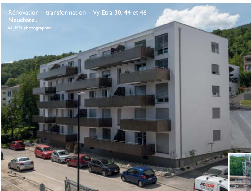
Rénovation – transformation – Vy Etra 30, 44 et 46 Neuchâtel.

Au cœur d'Estavayer, sur une parcelle idéale pour une nouvelle construction, SD Construction a érigé un immeuble de 7 appartements en PPE ainsi qu'un parking extérieur. Chaque logement bénéficie d'une vue dégagée sur le lac et les montagnes.