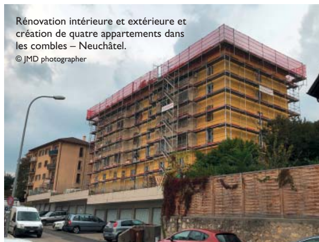
Rénovation intérieure et extérieure et création de quatre appartements dans les combles – Neuchâtel.

Entreprise Totale spécialisée dans la planification d'ouvrages, SD Construction applique des règles strictes basées sur des valeurs qu'elle pratique au quotidien. Sa flexibilité et sa rapidité à prendre des décisions sont certaines des clés de sa notoriété. Pour la rénovation comme la construction neuve, elle connaît les limites de ses possibilités, une philosophie qui la démarque d'autres sociétés et lui permet de satisfaire sa fidèle clientèle en lui assurant un suivi optimal du chantier. Ne pas privilégier l'économique avant l'humain est sans nul doute sa plus grande force. Des professionnels entourent chaque réalisation et pour toutes, les deux dirigeants sont directement impliqués et veillent au bon déroulement.