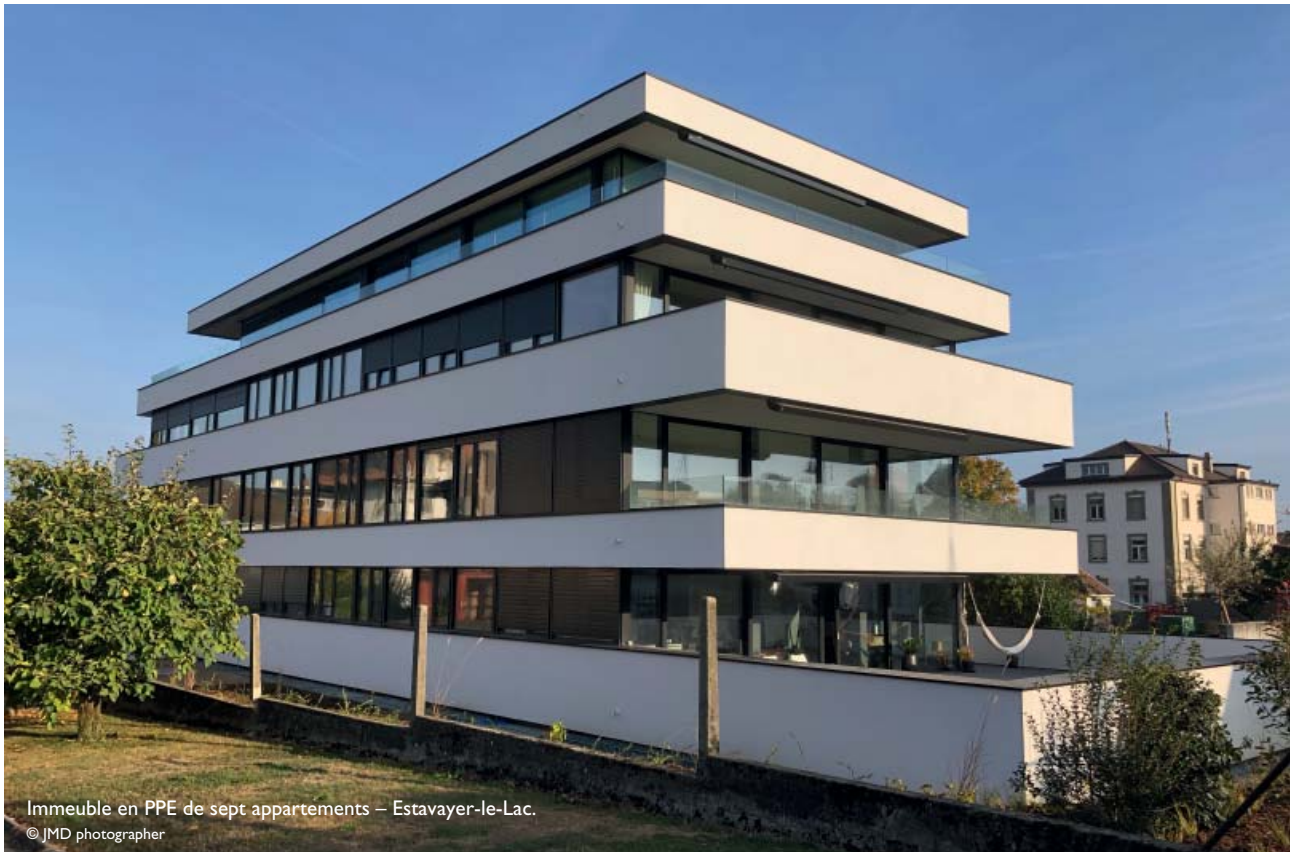
Immeuble en PPE de sept appartements – Estavayer-le-Lac.